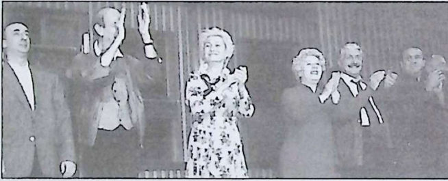
"Sen Hiç Ateş Böceği Gördün mü?" oyununu Frankfurt ve yöresinden 1500 kişi izlerken, sanatçılar seyirciyi uzun süre alkışladı.

masının trajik komik öyküsünü işliyor. Yılmaz Erdoğan'ın sinemayla gösterisiyle yer yer rol aldığı oyun, aynı zamanda güldürmek için kalitesizliğe, argo ve abartıya kaçmıyor ve Türkiye'nin son 50 yıllık siyasi ve ekonomik gelişmelerini ele alıyor. Ankara Sanat Tiyatrosu AST'nin genç kuşak oyuncuları ise, kendini "İşçilerin Soyтарыsı" olarak tanımlayan İtalyan yazar Dario Fo'nun "Ödenmeyecek! Ödemiyoruz" adlı eserini kuruluşun 39 yıllık onurlu geçmişine yaraşır biçimde sundu. İtalyan yazar Dario Fo'nun 1974 yılında kaleme aldığı bu oyun, İtalyan varoşlarında geçen sıradan bazı olayları "sulu komedi" biçiminde konu ediniyor ve 2 saat süreyle hızlı bir tempoda sonunda siyasi mesajı, seyircinin suratına düşünmesine bile fırsat bırakmadan vuruyor. Oyun, İtalya'daki dar gelirli insanları konu etse de, izleyenlere Türkiye'deki varoş yaşamlarını anımsatıyor..