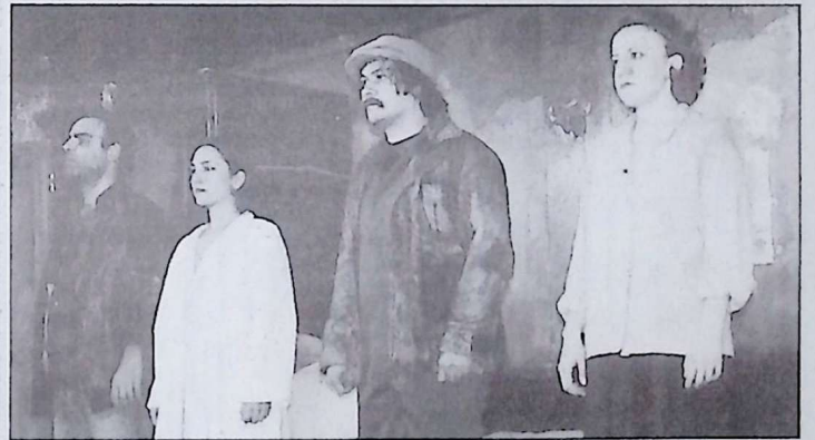
Bugünkü Türkiye'yi de andıran "Ödenmeyecek! Ödemeyeceğiz" adlı oyunun yazarı Dario Fo, bu çalışmasından ötürü İtalya'da halkı marketleri soymaya teşvik suçundan bir süre soruşturulmaya maruz kalmış.