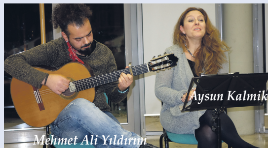
Mehmet Ali Yıldırım

6 yıl önce yitirdiğimiz ünlü çizerimiz Turhan Selçuk’un, bu özel karikatürlerini kendi bölgesinde de, sergilemek isteyenler, 0172 - 608 35 25 numaralı telefonla irtibat kurabilecek.