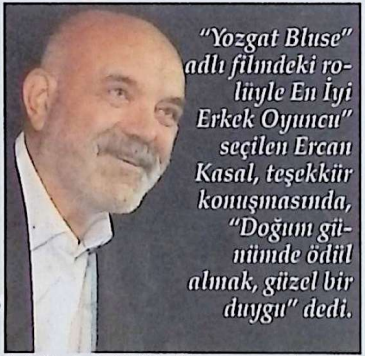
"Yozgat Blues" adlı filmdeki rolüyle En İyi Erkek Oyuncu" seçilen Ercan Kasal, teşekkür konuşmasında, "Doğum günümde ödül almak, güzel bir duygu" dedi.

Kültürlerin Transferi adlı derneğin öncülüğünde ve T.C. Kültür ve Turizm Bakanlığı desteğinde gerçekleşen festivalin 14. etabında, güncel yapımların yanı sıra, açık oturum ve sinema konulu sohbet toplantıları da programda yer aldı. Festivale ilgi geçen yıllara oranla bu sene az olurken, bu durgunluk gelen sanatçı sayısında da gözlemlendi. Uzmanlar, bu ilgi azlığını büyük ölçüde yaz