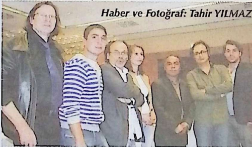
Haber ve Fotoğraf: Tahir YILMAZ

Öte yandan dünyanın en büyük kitap fuarı ve yayıncılık sektörünün kalbi olarak bilinen Frankfurt Uluslararası Kitap Fuarı, kapılarını bu ay (14-18 Ekim) 61. kez açmış olacak. Kitap kurtları bu 5 gün boyunca dünyanın dört bir köşesinden gelen kitapları soluma olanağını bulacak. Bunu da unutmayalım ve İstanbul'a yolunuz düşerse bile, Frankfurt'taki dev etkinliği mutlaka gezin diyorum.